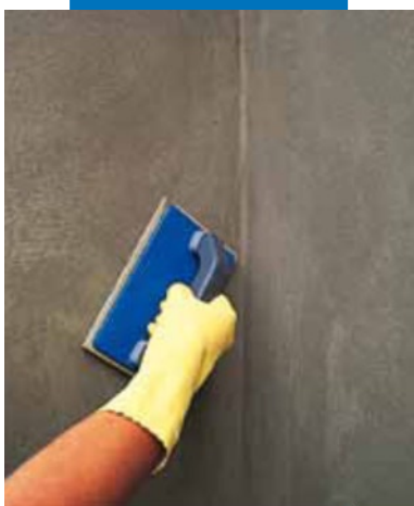
Финишная обработка губчатой теркой