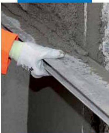
Выравнивание MapegROUT 430 при помощи правила

арматуры, зазор между поверхностью и арматурой должен составлять не менее 20 мм.