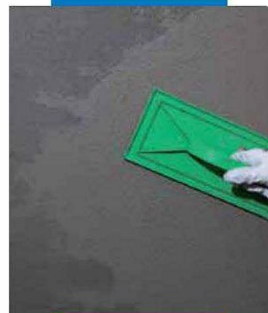
Трамбовка Mapegrout 430