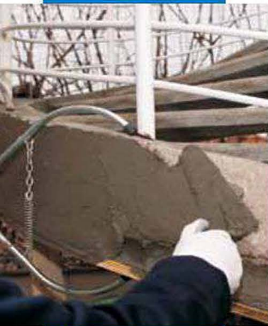
Нанесение MapegROUT 430 при помощи мастерка