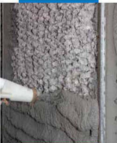
Нанесение MapegROUT 430 набрызгом